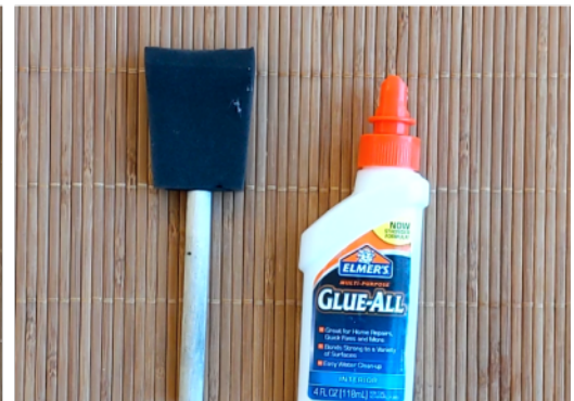
PEGAMENTO BLANCO Y PINCEL