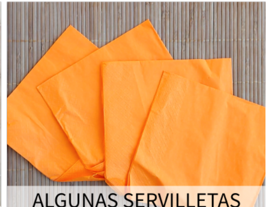
ALGUNAS SERVILLETAS DE PAPEL