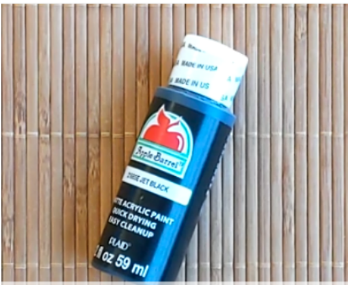
PINTURA ACRÍLICA NEGRA