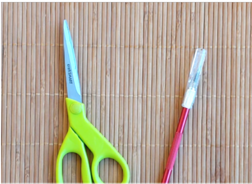
TIJERAS O CUCHILLA DE MANUALIDADES