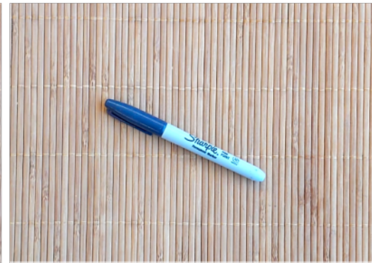
UN MARCADOR FINO ("SHARPIE") NEGRO