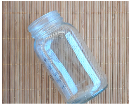
UN FRASCO DE VIDRIO